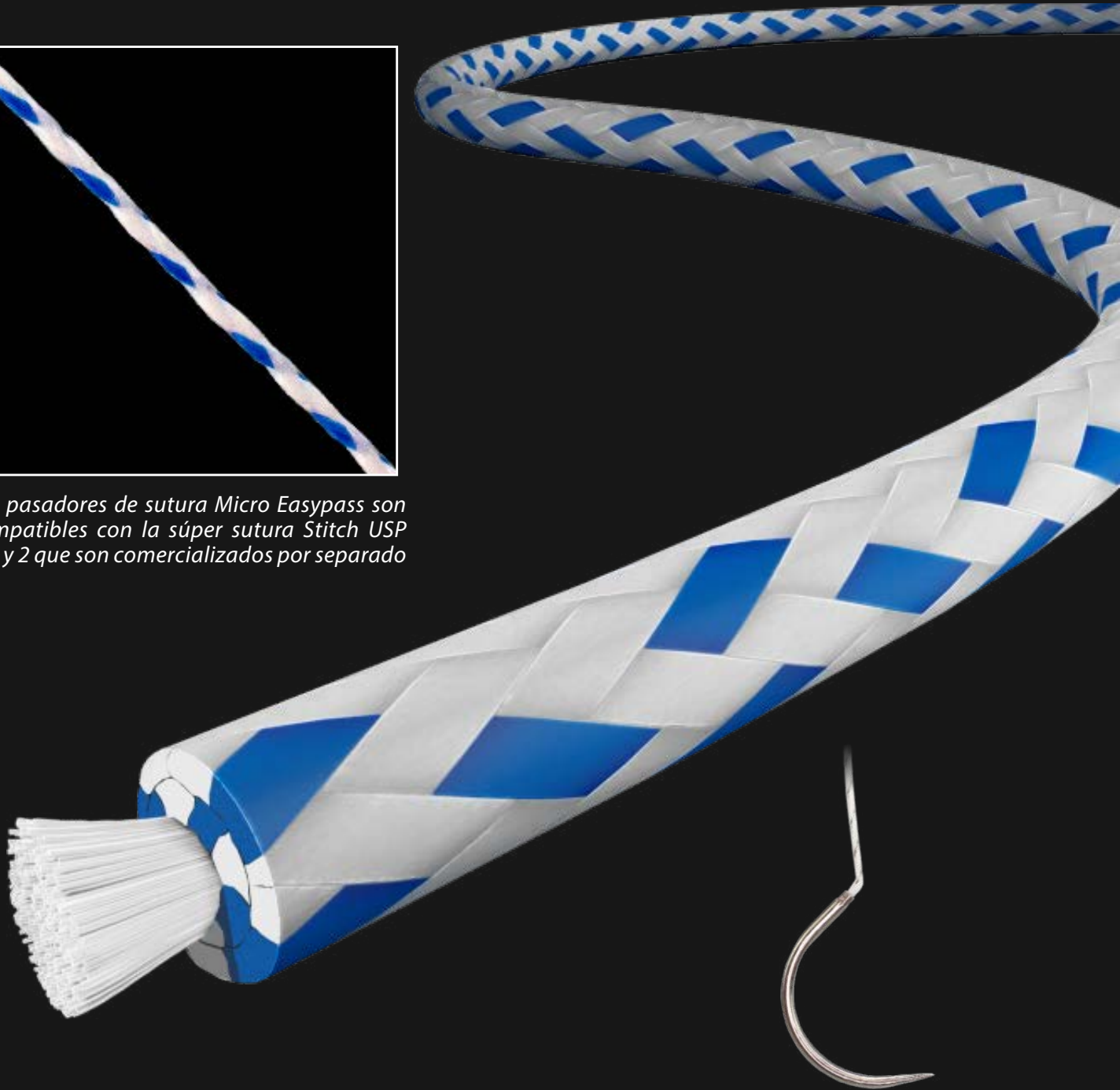
Fig.: Todas las suturas y cintas quirúrgicas se colocan con aguja.

Los pasadores de sutura Micro Easypass son compatibles con la súper sutura Stitch USP 2-0 y 2 que son comercializados por separado